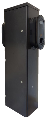
Izstrādājuma attēlam ir informatīvs raksturs